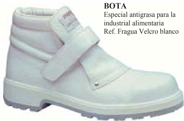
BOTA Especial antigrasa para la industrial alimentaria Ref. Fragua Velcro blanco