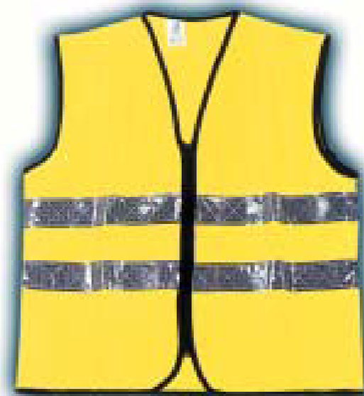
CHALECO 100% Poliester Ref. EAV-15