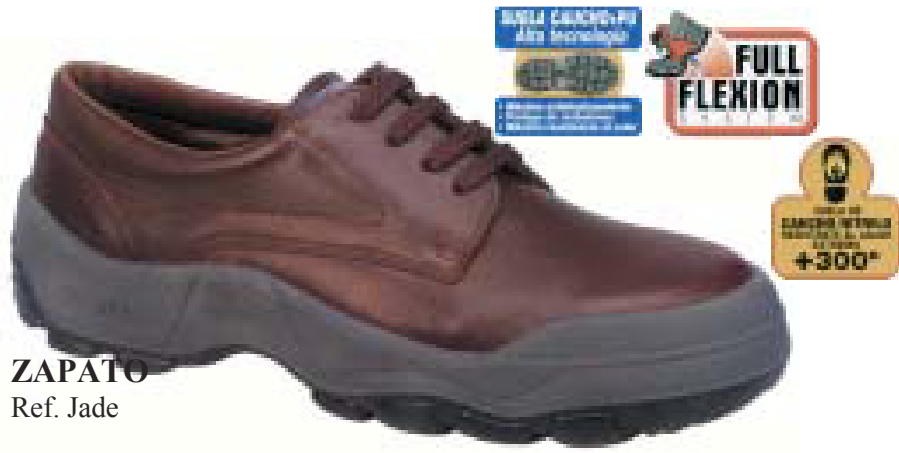
ZAPATO Ref. Jade