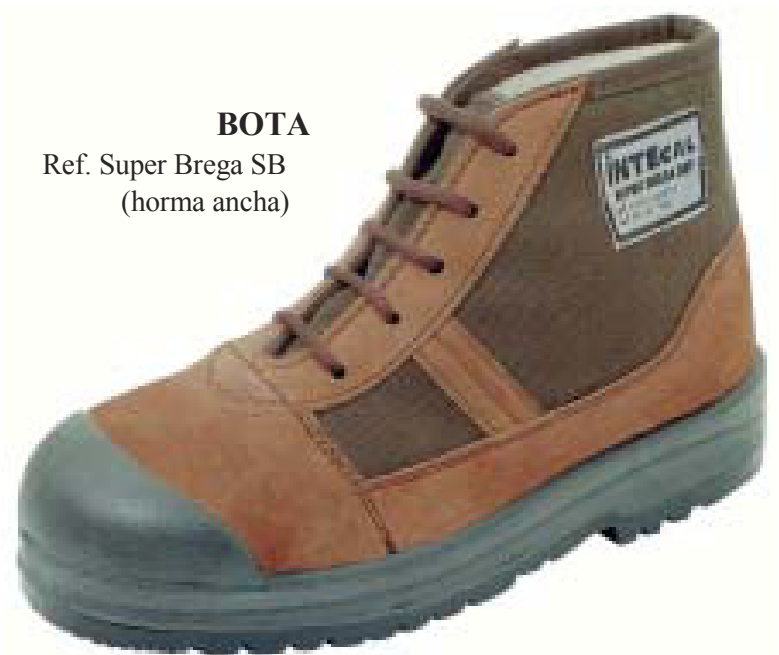
BOTA Ref. Super Brega SB (horma ancha)