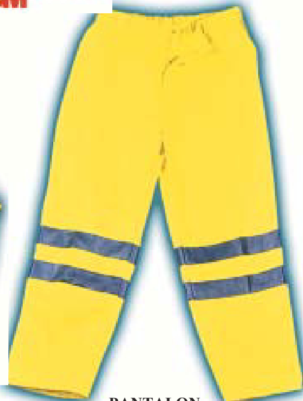
PANTALON 65% Poliester / 35% Algodón Ref. EAV-10