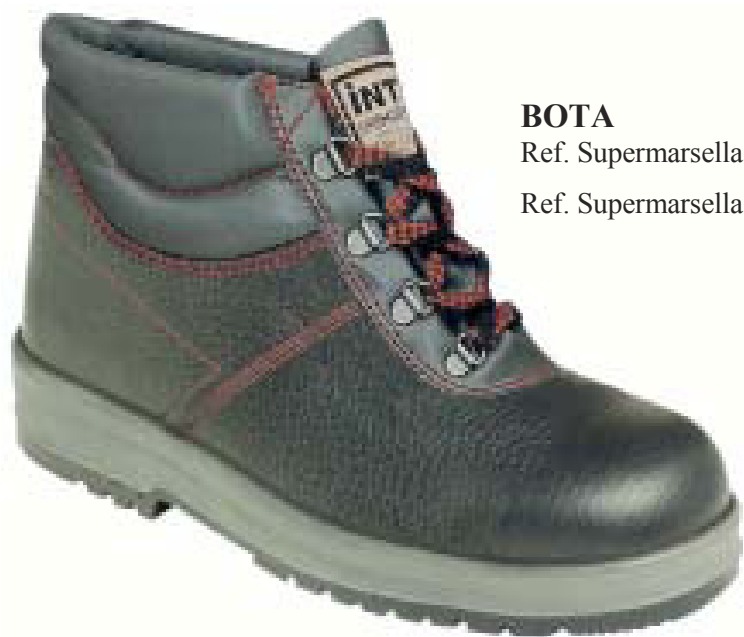
BOTA Ref. Supermarsella S2 Ref. Supermarsella S3