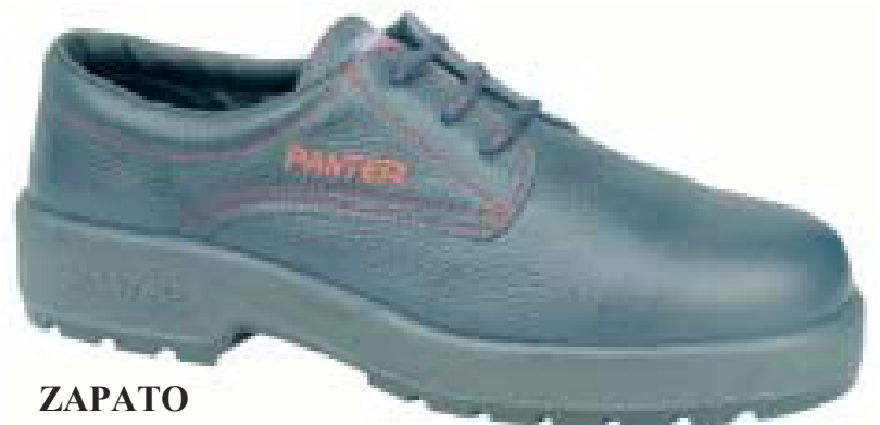
ZAPATO calzado de seguridad para la mujer. Color azul Ref. Carol S2