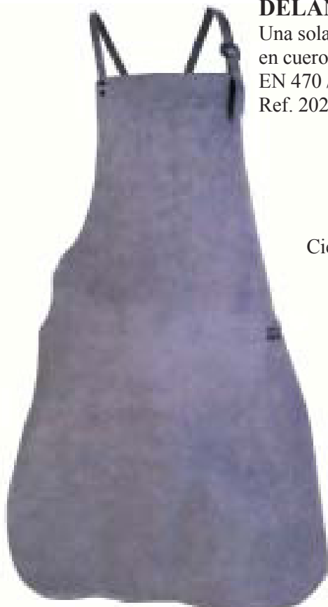
DELANTAL Una sola pieza, en cuero vacuno EN 470 / EN 340 Ref. 20200