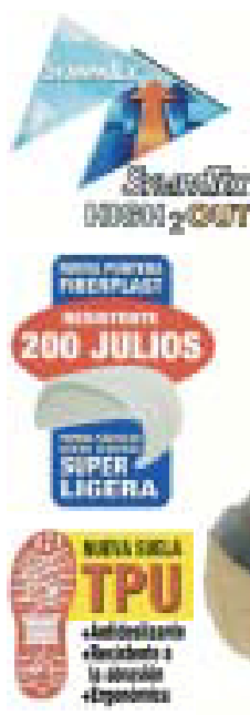
BOTA Especial electricistas contra riesgos eléctricos.