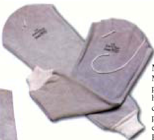
MANGAS Mangas de cuero para proteger el brazo hasta el hombro, con puño elástico y cintas para atarlas a través de la espalda Ref. 20400