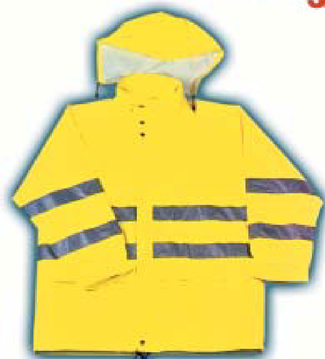
PARKA 100% Poliester Ref. EAV-5