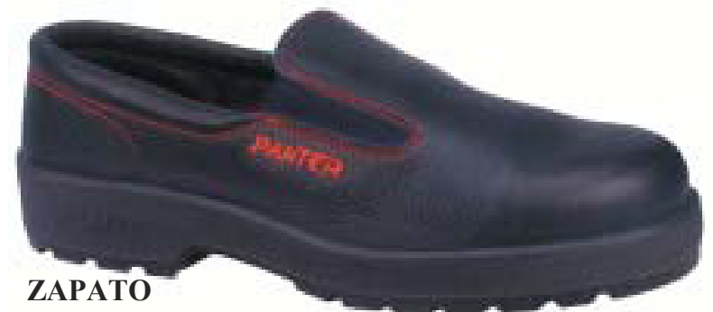
ZAPATO calzado de seguridad para la mujer en el trabajo. Color azul Ref. Esther S2