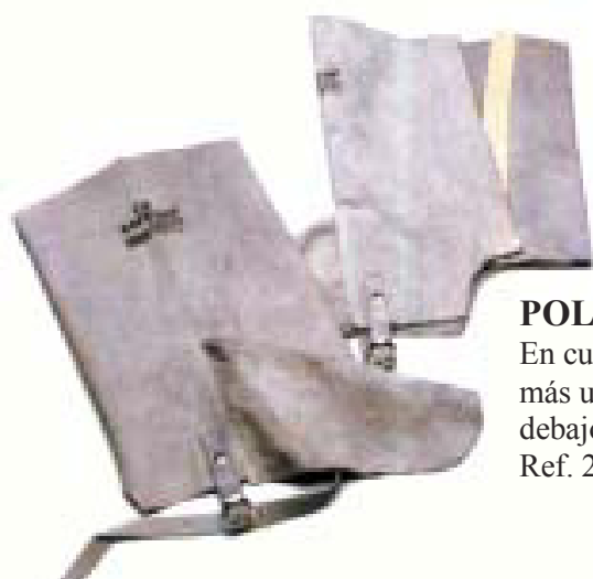
POLAINAS En cuero, cierre de velcro más una cinta de ajuste por debajo del calzado Ref. 20300