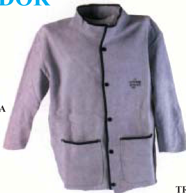
CHAQUETA Piel crupón. Cierre mediante corchetes en pecho y mangas. Ref. 20100