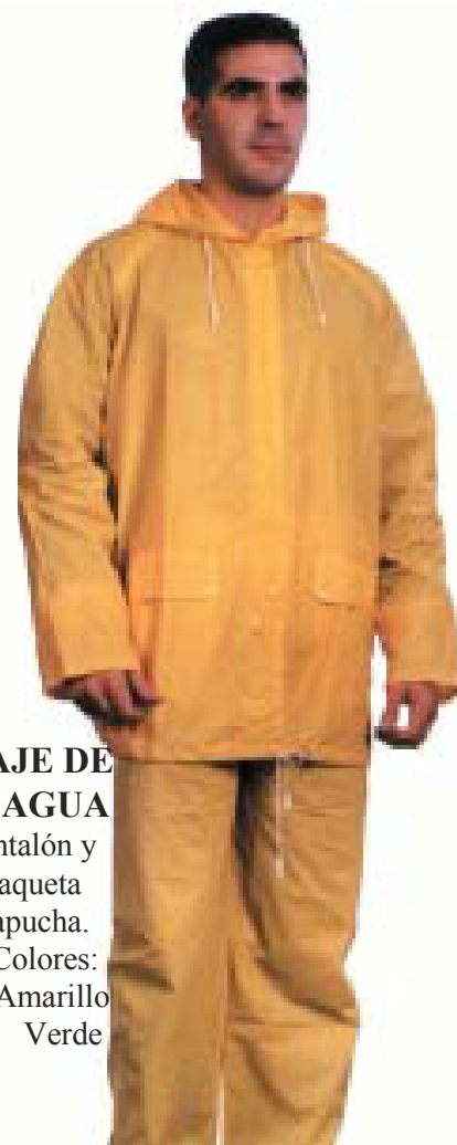
TRAJE DE AGUA Pantalón y chaqueta con capucha. Colores: Amarillo Verde